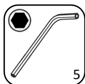
Clé Allen (fournie)