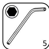
Clé Allen (fournie)