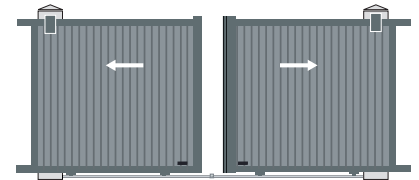
2 vantaux symétriques